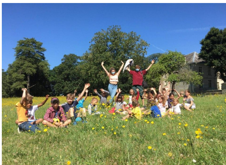
Centre de loisirs : été 2020

Renseignements auprès de Vanessa Pipet au : 06 48 49 43 51