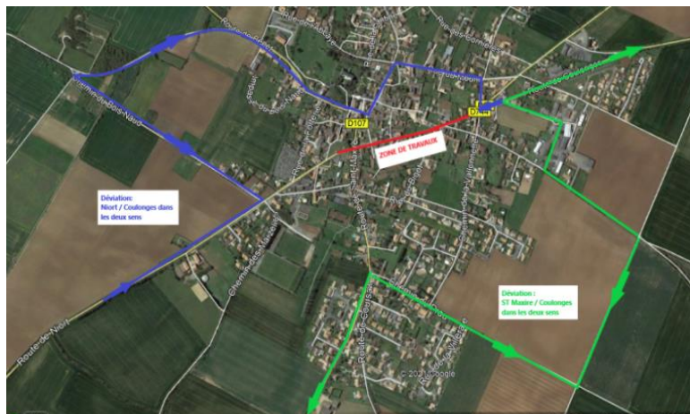
Plan des déviations

Une signalétique spécifique permettra d'accéder aux commerces et services impactés par la zone de travaux.