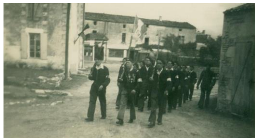
Défilé de FFI dans le bourg de Villiers le jour de la fête de la libération (octobre 1944)

La municipalité organisera du 8 au 11 novembre prochain une exposition qui portera sur des parcours de guerre, du Premier Empire à la Libération. À cette occasion, de nombreux objets et documents seront présentés. Seront également organisées du samedi au lundi trois conférences portant sur des destins de soldats napoléoniens des Deux-Sèvres et de Villiers-en-Plaine, sur les animaux dans la Guerre 14-18 et sur la résistance des fonctionnaires en Deux-Sèvres en 1943-1944.